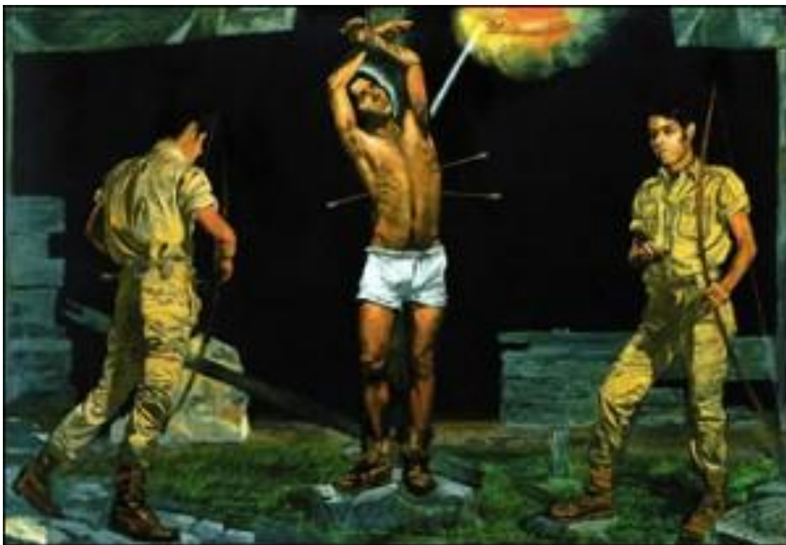
Γιάννης Τσαρούχης "Το μαρτύριο του Αγίου Σεβαστιανού"

ΑΛΕΞΙΟΣ ΣΑΒΒΑΚΗΣ "ΙΩΑΝΝΗΣ ΤΣΑΡΟΥΧΗΣ" Εκδόσεις ΚΑΣΤΑΝΙΩΤΗ