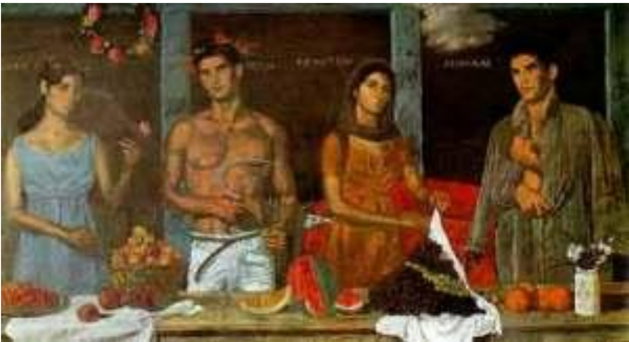
Γιάννης Τσαρούχης "Οι 4 εποχές"

ΑΛΕΞΙΟΣ ΣΑΒΒΑΚΗΣ "ΙΩΑΝΝΗΣ ΤΣΑΡΟΥΧΗΣ" Εκδόσεις ΚΑΣΤΑΝΙΩΤΗ