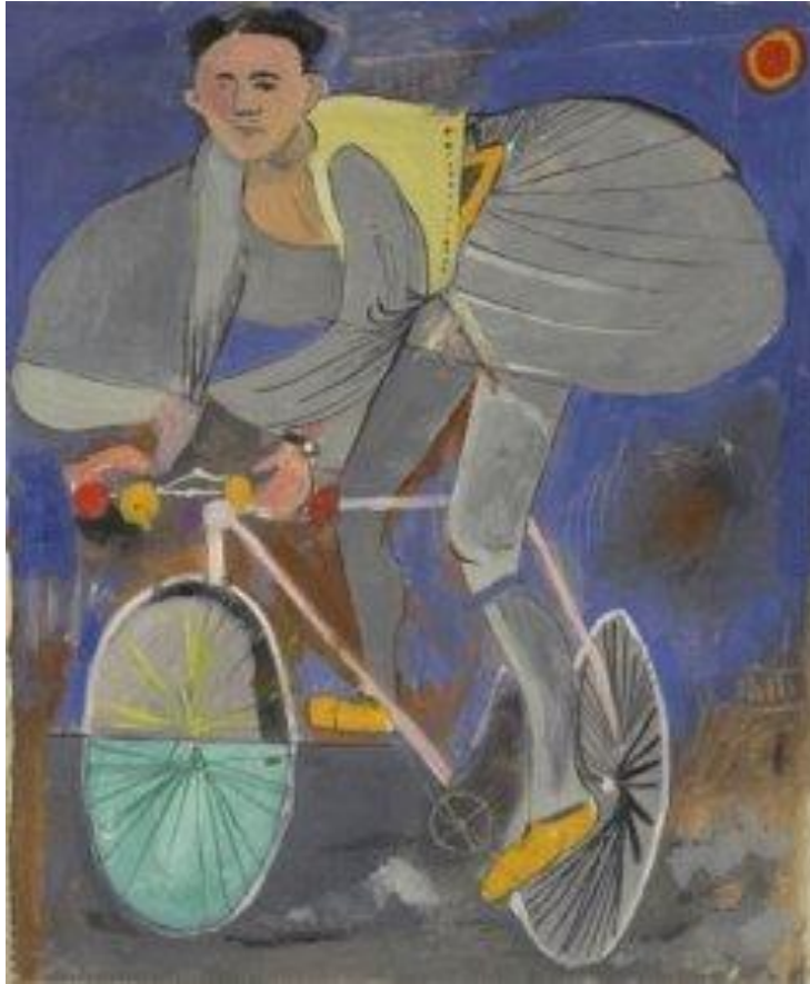
Γιάννης Τσαρούχης "Ποδηλάτης μεταμφιεσμένος σε τσολιά, μ' ένα ναό δεξιά κάτω" (1936) Ίδρυμα Γ. Τσαρούχη

Δεν ζητώ ανθρώπους να σκέφτονται σαν εμένα, αλλά να κάνουν σκέψεις συμπληρωματικές των δικών μου.