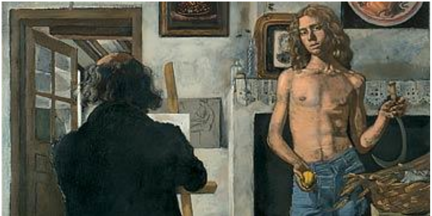
Γιάννης Τσαρούχης (1910-1989)