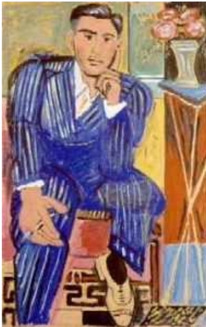
Γιάννης Τσαρούχης "Σκεπτόμενος"

ΑΛΕΞΙΟΣ ΣΑΒΒΑΚΗΣ "ΙΩΑΝΝΗΣ ΤΣΑΡΟΥΧΗΣ" Εκδόσεις ΚΑΣΤΑΝΙΩΤΗΣ